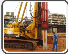
Ensaio de carregamento dinâmico (PDA)