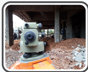
Monitoramento de recalques