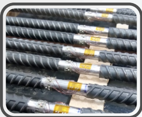
Instrumentação de estacas em profundidade