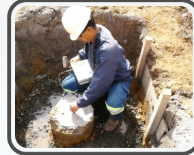
Ensaio de integridade (PIT)