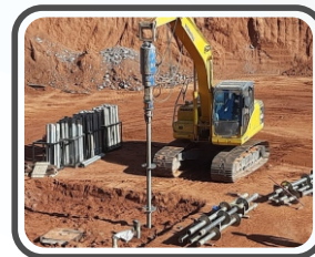
Ancoragem para provas de carga (SAP)