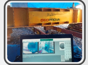
Prova de carga estática direta - em placa