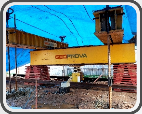
Prova de carga estática em estacas (PCE)