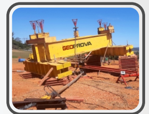
Provas de carga customizadas